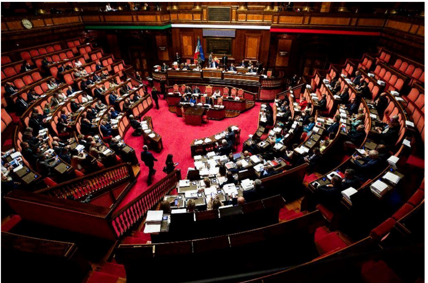
L'Aula del Senato, dove ora è atteso (in data ancora da definire) il ddl sulla maternità surrogata "reato universale"