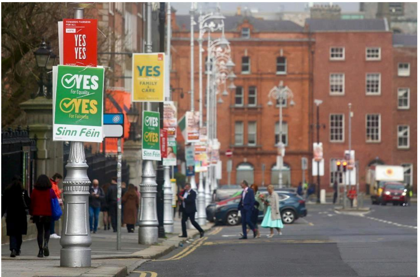
La campagna referendaria per le strade di Dublino - Ansa

Cosa dice il clamoroso esito delle recenti consultazioni popolari che ha fermato il cambiamento di due articoli della Costituzione sulla definizione di famiglia e il ruolo della donna nella società