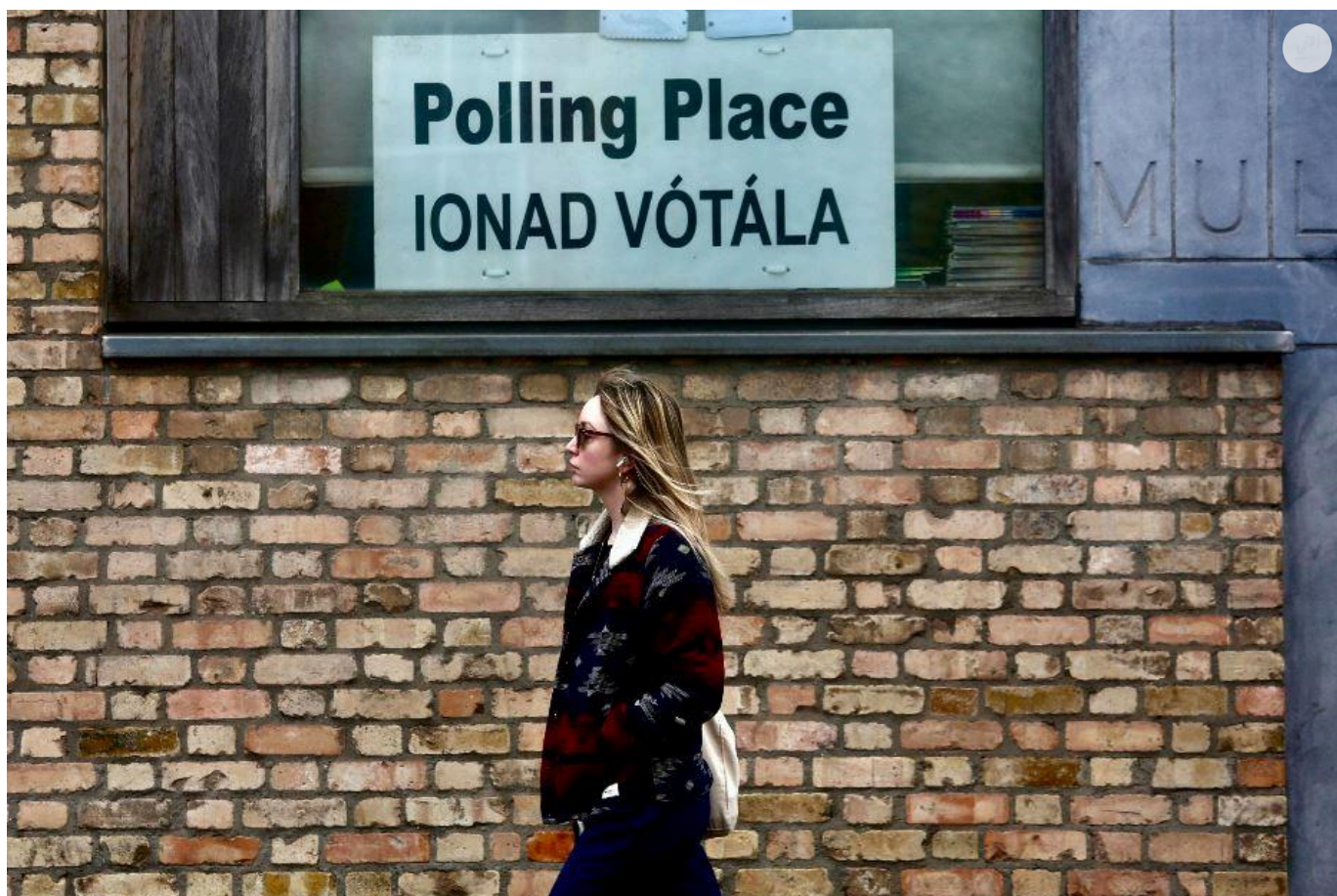
Un seggio per il referendum dell'8 marzo

Quindi nessun fraintendimento. «Si respira un'aria di protesta antisistema – aggiunge Bottone –, simile a ciò che sta avvenendo in altri Paesi europei ma che qui deve ancora trovare un'espressione politica. L'Irlanda è un Paese che ha vissuto il processo che negli altri Paesi europei è durato 60 anni: il passaggio da una relativa povertà al boom economico, da una società tradizionale a una secolarizzata, ma l'ha fatto in ritardo e in modo accelerato. Ora è come se dopo l'euforia emergessero numerosi problemi. A partire dal rapporto con l'immigrazione».