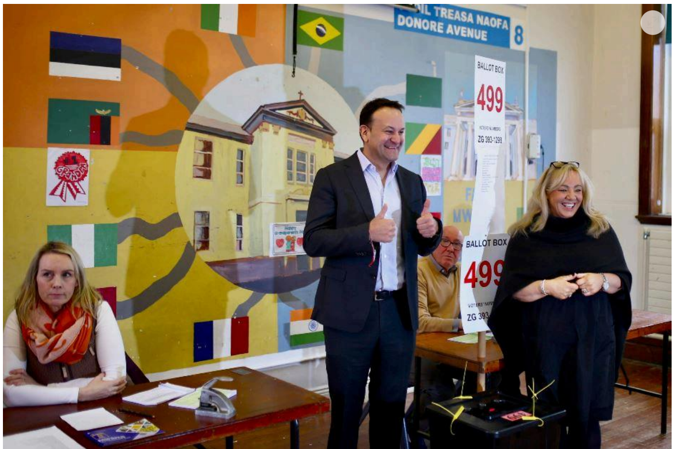
Il premier irlandese Leo Varadkar, sostenitore del sì, e la senatrice Mary Seery Kearney al seggio

Con un'affluenza del 44,4%, il referendum Family ha visto il "no" vincere con il 67,7% contro il 32,3% del "sì"; nel referendum Care il "no" ha toccato il 73,9% contro il 26,1% dei "sì". Quest'ultimo risultato rappresenta la più alta percentuale di voti "no" tra tutti i referendum mai tenutisi nell'Isola di Smeraldo. Nella contea del Donegal i "no" hanno addirittura superato l'80%.