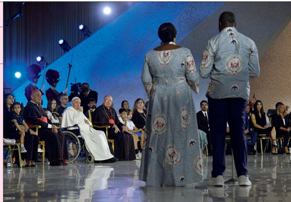
L'incontro mondiale delle famiglie con papa Francesco a Roma (giugno 2022)