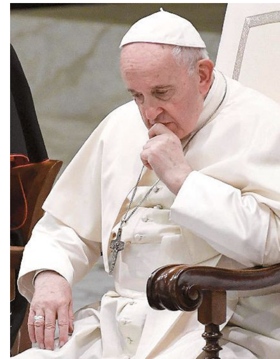
Il Papa durante l'incontro di ieri mattina

La sofferenza di fronte a crimini con vittime sempre più giovani e la richiesta di un movimento che unisce le agenzie educative nella protezione dei piccoli