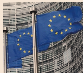
GLI ALTRI PAESI

Scrive la Cassazione che «all'adozione in casi particolari possono accedere sia le persone singole che le coppie di fatto» e «l'esame dei requisiti e delle condizioni (...) non può essere svolto dando rilievo all'orientamento sessuale del richiedente». Inoltre, nel caso esaminato, la Suprema corte non si è posta il problema sull'applicazione della recente legge sulle unioni civili, posto che quest'ultima è entrata in vigore solo il 5 giugno scorso e che non ha efficacia retroattiva.