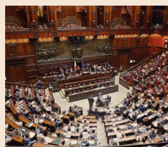
LEGGE UNIONI CIVILI

La Cassazione ha respinto i due motivi di ricorso del Pg sulla base delle seguenti motivazioni: 1) la stepchild adoption «non determina in astratto un conflitto di interessi tra il genitore biologico e il minore, ma richiede che l'eventuale conflitto sia accertato in concreto dal giudice»; 2) tale tipo di adozione «prescinde da un preesistente stato di abbandono del minore e può essere sempre ammessa sempreché, alla luce di una rigorosa indagine di fatto svolta dal giudice, realizzi effettivamente il preminente interesse del minore».