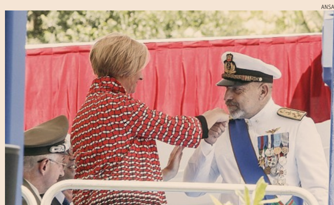
La cerimonia. Il ministro della Difesa Roberta Pinotti e l'ammiraglio Giuseppe De Giorgi, da ieri ex capo di stato maggiore della Marina

Ma l'intervento del generale Graziano tira una linea di separazione rispetto a De Giorgi. «I vertici militari si trovano oggi nella difficoltà di proporre talvolta scelte difficili, coraggiose e talora anche dolorose, di privilegiare gli aspetti possibili rispetto a quelli desiderabili. Ed emerge importante la volontà di superin-