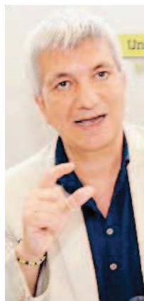
Nichi Vendola presidente di Sel

«Vincerebbe il sì. L'omosessualità non è più un tabù, è entrata nelle case di tutti e questo aiuta tanti adolescenti a uscire fuori dal silenzio».