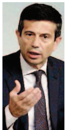
Maurizio Lupi capogruppo Ncd

«Primo, le convivenze non possono essere in alcun modo equiparate alla famiglia o al matrimonio. Secondo, non ci deve essere l'equiparazione alla famiglia, il che significa no all'adozione dei figli visto che i bambini hanno diritto ad avere una mamma e un papà. E infine non ci può essere la reversibilità della pensione».