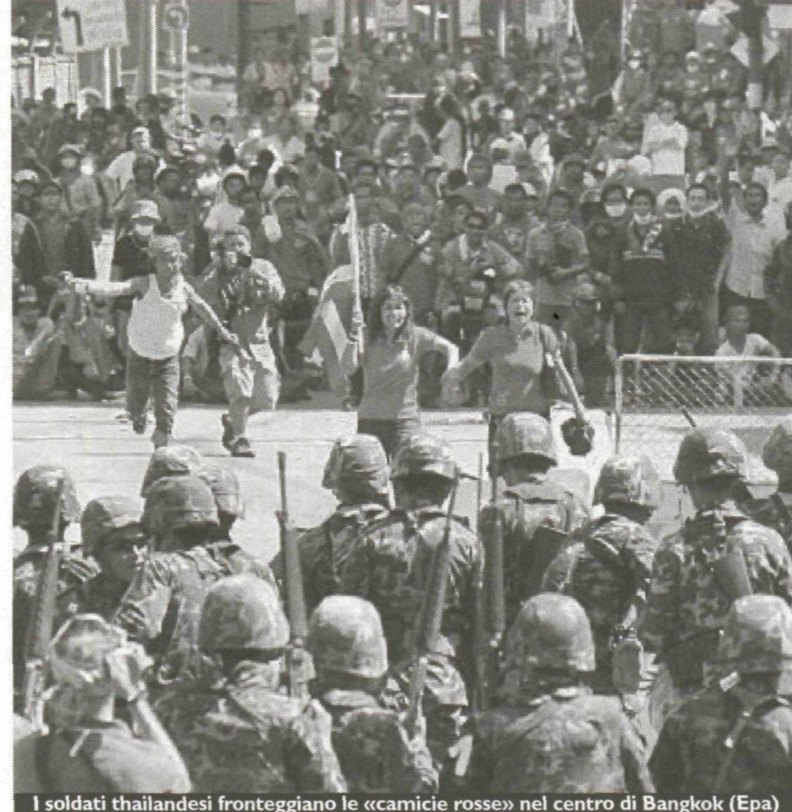
I soldati thailandesi fronteggiano le «camicie rosse» nel centro di Bangkok

Nella piazza del Monumento alla Vittoria era iniziata giovedì, con il blocco del traffico, la sfida decisiva delle "camicie rosse" a un governo cui disconoscono ogni legittimità; ieri la grande spianata circolare ha visto una vera e propria battaglia. Poco prima di mezzogiorno centinaia di poliziotti di soldati hanno caricato la barriera di autobus, copertoni in fiamme e transenne tra gli applausi dei cittadini. Lo scontro si è acceso poco dopo su un'altra arteria essenziale, su cui si affaccia il ministero degli Esteri, Si Ayutthaya. Qui una falange di uomini in divisa affiancati da blindati e da camion con idranti