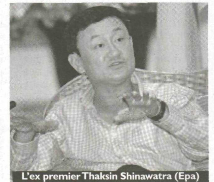
L'ex premier Thaksin Shinawatra

Thaksin Shinawatra, dall'esilio ha incitato i suoi a convergere su Bangkok per chiudere la partita con chi ha impedito prima a lui e, dopo la sua partenza per l'esilio nel settembre 2006, ai suoi eredi politici di esercitare il potere senza sostituirlo con prospettive credibili per la popolazione meno favorita. Ai suoi, ha detto e ripetuto che, in caso di uso della forza contro di loro o di colpo di stato militare, tornerà per lottare al loro fianco. Potrebbe essere vero o forse no, importante che le "camicie rosse" ci credano e per questo siano disposte ad arrivare fino alla guerra civile. (S.V.)