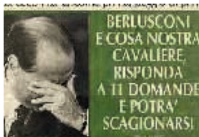
L'edizione della Padania con le domande