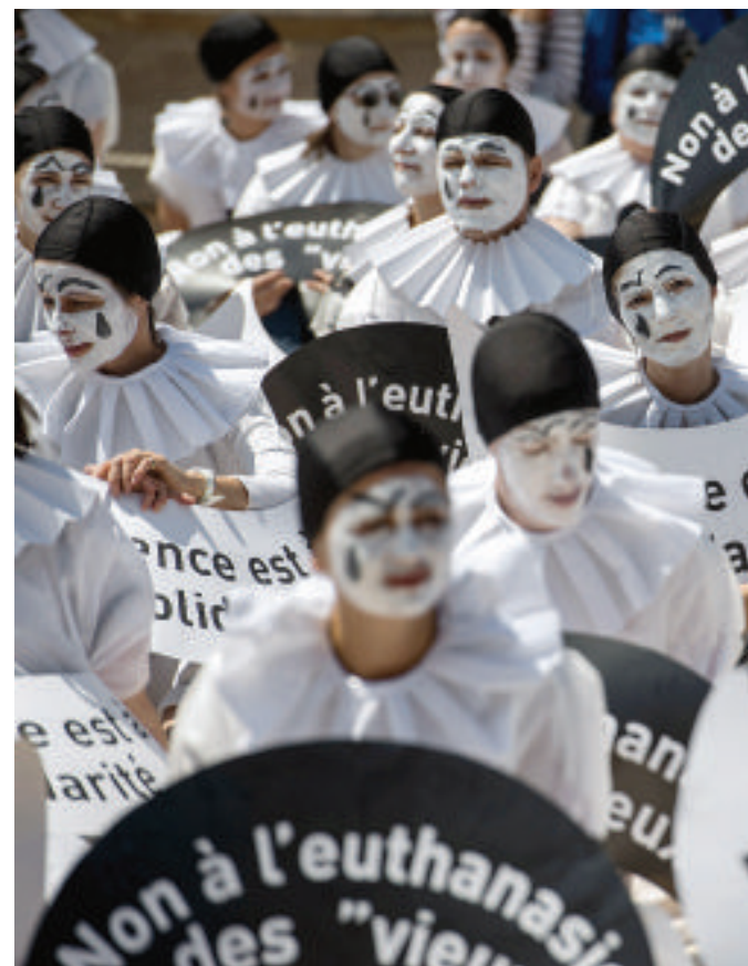
Manifestanti anti eutanasia in piazza ieri a Parigi