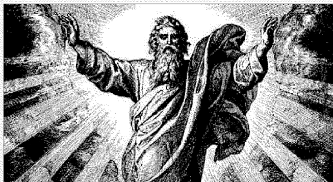
► Queste sono le prime 3 immagini che si trovano cercando God su Google