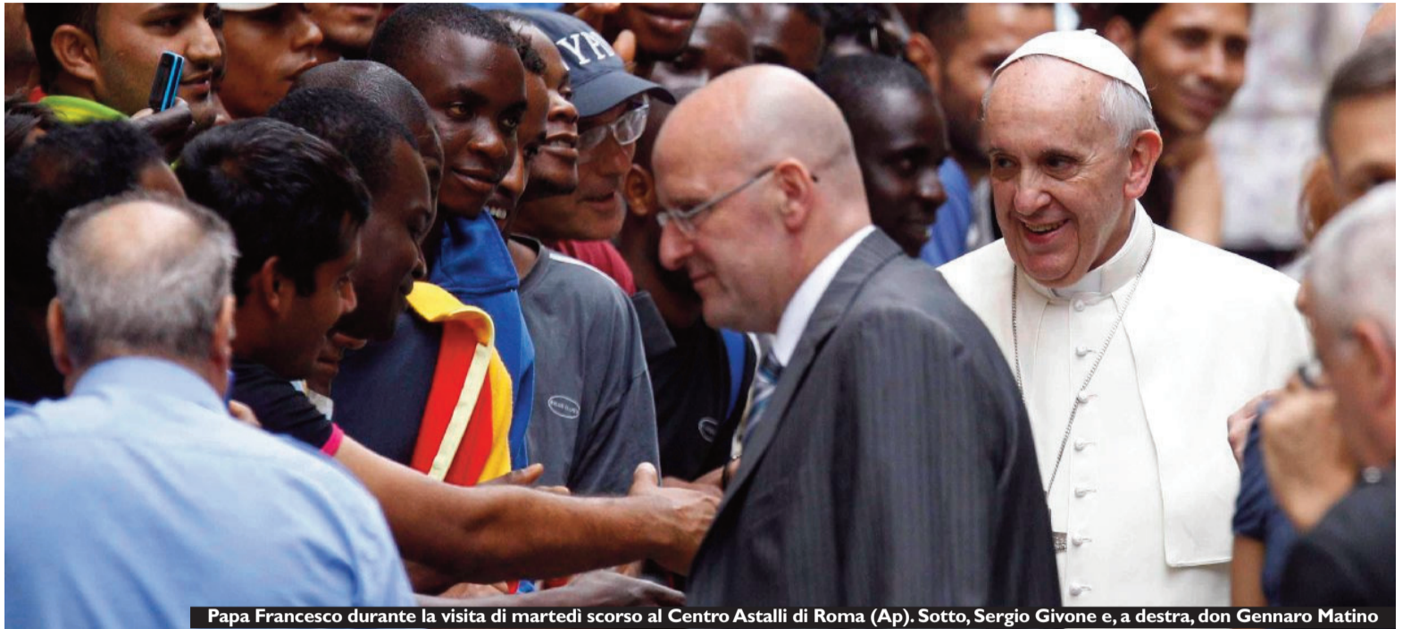
Papa Francesco durante la visita di martedì scorso al Centro Astalli di Roma (Ap). Sotto, Sergio Givone e, a destra, don Gennaro Matino

Dopo la lettera del Papa rivolta principalmente ai non credenti, diventa sempre più vivace lo scambio fra pensatori di estrazione differente