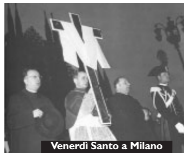
Venerdi Santo a Milano