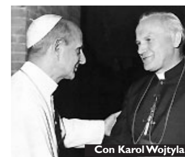
Con Karol Wojtyła

Fra le riforme e le innovazioni apportate da Paolo VI nella struttura e nella vita della Chiesa si possono ricordare l'istituzione della Pontificia Commissione per le comunicazioni sociali (1964), del Segretariato per i non cristiani (1964), del Segretariato per i non credenti (1965), del Sinodo dei Vescovi (1965), del Pontificio Consiglio per i laici e della Pontificia Commissione «Iustitia et pax» (1967), della Prefettura della Casa Pontificia (1967), del