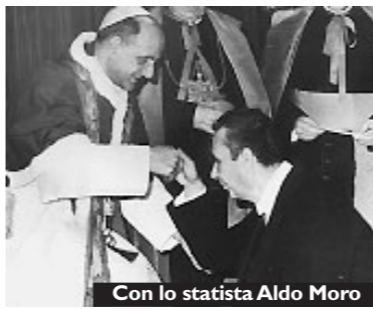
Con lo statista Aldo Moro

Vaticano II che concluderà solennemente l'8 dicembre 1965. Il 1° gennaio 1968 celebra la prima Giornata mondiale della pace. Il 24 dicembre 1974 apre la Porta Santa nella Basilica di San Pietro, inaugurando l'Anno Santo del 1975. Il 16 aprile 1978 scrive alle Brigate Rosse implorando la liberazione del presidente della Dc Aldo Moro e il 13 maggio nella Basilica di San Giovanni in Laterano assiste alla Messa in suffragio dello statista