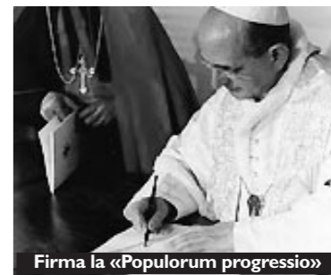
Firma la «Populorum progressio»

Queste le encicliche di Paolo VI: Ecclesiam Suam (6 agosto 1964) sul dialogo all'interno della Chiesa e della Chiesa con il mondo; Mense Maio (29 aprile 1965) che invita a pregare la Madonna per il felice esito del Concilio e per la pace nel mondo; Mysterium fidei (3 settembre 1965) sull'Eucaristia; Christi Matri (15 settembre 1966) con la quale chiede preghiere alla Madonna per la pace nel mondo; Populorum progressio (26 marzo 1967) sullo sviluppo dei popoli; Sacerdotalis caelibatus (24 giugno 1967) sul celibato sacerdotale; Humanae vitae (25 luglio 1968) sul matrimonio e sulla regolazione