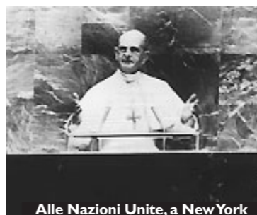
Alle Nazioni Unite, a New York

Paolo VI tenne sei Concistori (22 febbraio 1965; 26 giugno 1967; 28 aprile 1969; 5 marzo 1973; 24