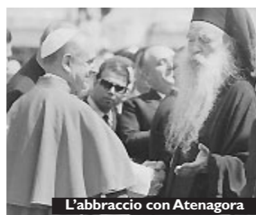
Labbraccio con Atenagora