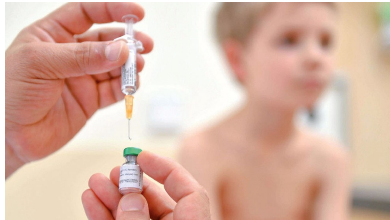
In base alla legge in vigore i vaccini obbligatori per la frequenza scolastica sono 10 e riguardano poliomielite, difterite, tetano, epatite B, pertosse, "haemophilus influenzae" di tipo B e morbillo

né il secondo né il terzo richiamo, per trascuratezza, dimenticanza, negligenza dei genitori. Ma anche i medici hanno le loro responsabilità. Un'allarme, sul "pericolo morbillo", viene anche dalla onlus Fiagop, la federazione che riunisce le associazioni delle famiglie con bambini e adolescenti che hanno avuto tumori e leucemie: ogni anno, precisa l'associazione, sono circa 2.100 quelli che si ammalano e, anche se, fortunatamente, otto su dieci guariscono, il loro sistema immunitario rimane fortemente compromesso, tanto che ogni infezione, anche la più banale, può avere conseguenze gravissime. La malattia esantematica provoca le caratteristiche macchie rossastre sulla pelle ed è sempre associata a tosse stizzosa e febbre che sale con puntate ogni giorno più alte fino alla comparsa delle manifestazioni cutanee poi gradatamente decresce. Se trascurata può portare a complicanze come polmonite e vari gradi di encefalite e in percentuale ridotta anche alla morte. Come evitare quindi di contagiare gli altri? «Innanzitutto gli operatori sanitari dovrebbero fornire il proprio calendario vaccinale, lo stesso andrebbe fatto dagli insegnanti e dai dipendenti delle aziende private e del settore pubblico - dice Molinari -, andrebbero svolti controlli a tappeto nella fascia di età 18-30, e laddove emergano casi di non vaccinazioni o di trattamenti parziali, rimediare subito: la seconda vaccinazione è essenziale e fa stare tutti tranquilli».