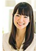
La saggista Marie Kondo

sereno il rapporto con gli oggetti che possiedono, liberandosi del superfluo. È il cosiddetto «metodo KonMari» (dal nome dell'autrice trentunenne), che per esempio suggerisce di misurare il grado di gioia che ci danno le cose per decidere se è arrivato il momento di disfarsene. Il precedente bestseller di Marie Kondo, intitolato Il magico