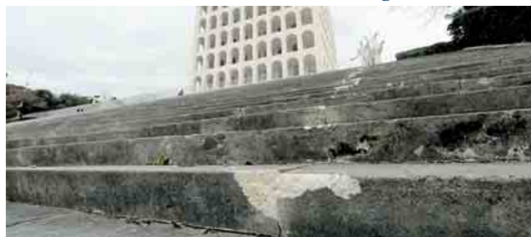
La scalinata danneggiata del Palazzo della Civiltà del lavoro, il colosseo quadrato

La scalinata del Palazzo della Civiltà sfregiata dal branco