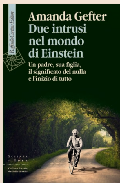
Amanda Gefter Due intrusi nel mondo di Einstein Un padre, sua figlia, il significato del nulla e l'inizio di tutto