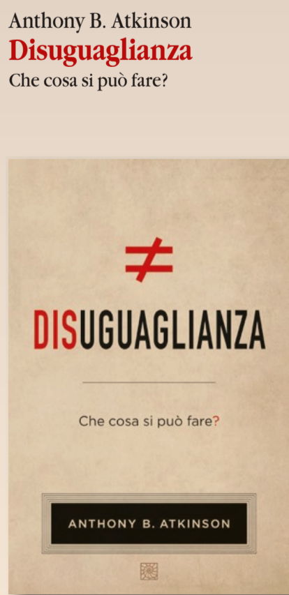
Anthony B. Atkinson Disuguaglianza Che cosa si può fare?