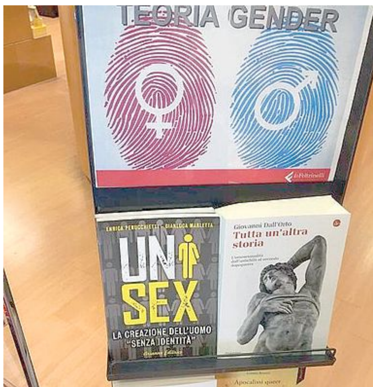
IN LIBRERIA Lo scaffale dedicato alla letteratura sul 'gender'

che ha visto incrinarsi perfino i muri portanti del Mulino Bianco, all'annuncio del numero uno Apple si sarà lasciato andare a un liberatorio «W la Nokia». Ma è sempre più solo, perché la comunicazione, diretta o subliminale, percorre strade diverse. Era il 25 settembre 2013 e Guido Barilla, ai microfoni di Radio24, dichiarò